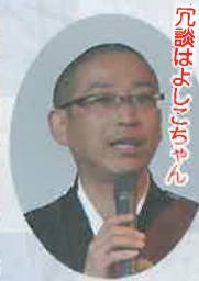
「これ当たり前だのクラッカー」