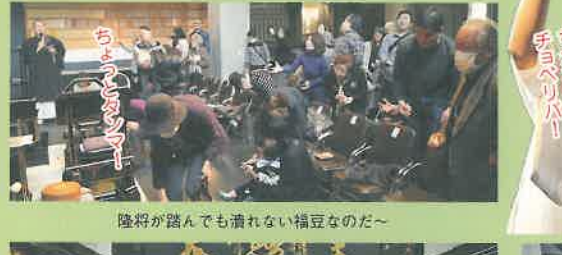
隆将が踏んでも潰れない福豆なのだ〜