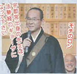
「手塚の先生は法華経のキョウをいって下さる」