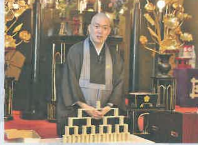
今の自分から10代選ると先祖は1184人います。

「ありがどうの反対言葉は？」と聞かれた先生。会場は「漢字で書く」と「有難う」「有難い」「有易い」「当たり前」。当たり前前のこと。有ればお湯が出るのは奇跡でした。ひねればお湯が出るのは奇跡でした。今でも日本人の暮らしは発展途上国からすると雲泥の差がありますが、文明が進む事と幸せを感じる事は違います。命を頂いたことが、そして法華経に出遭った事が有り難い。そう感じられるようになるのは日々のトレーニングが必要です。「すみません」「ありがどう」に言い換えてみましょう。「いただきます」と心に寄せる習慣をつけましょう。貴方は先祖と家族に毎日感謝していますか？