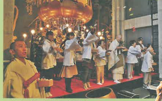
あつと薫くたメ五郎〜 年男女は今回は余裕のよっちゃん 11人なのだ