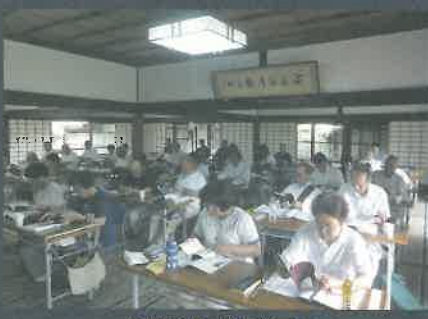
水の如く信ぜさせ給えるか