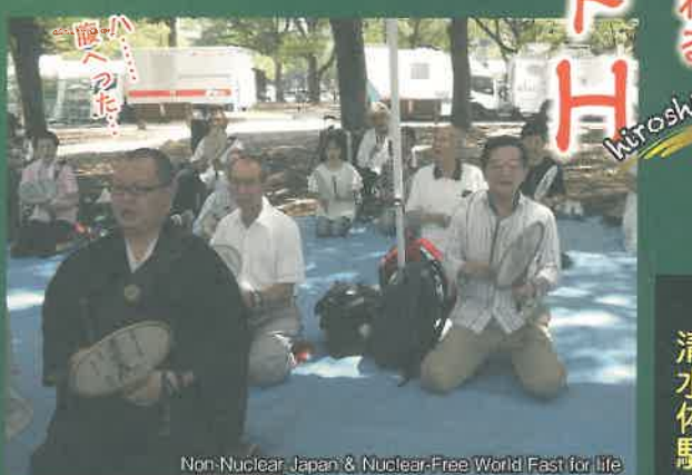
Non-Nuclear Japan & Nuclear-Free World Fast for life

と共に、みなが平和を望み兵器のない世の中を理想としているのに、なぜ、理想とする世の中に近づいていかなのかと、考えながらお題目をお唱えしておりました。