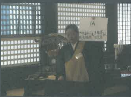
そもそも地獄と仏とはいづれの所に候ぞ