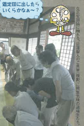
立正安国論に絡み、日蓮聖人の「其善法に稱ずる乳力の道場生たち」