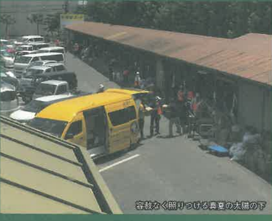
屋根から降りつづける真夏の太陽の下

フリーマーケット方式で、被災者が必要な物を必要なだけ自分で袋に入れて持ち帰るといふことでしたが、物資の中には冬服があったり、いくら無償であっても「ここまで汚れては着られないだろう」というものもありました。提供する側も、考えなければならぬ一面だと思いました。