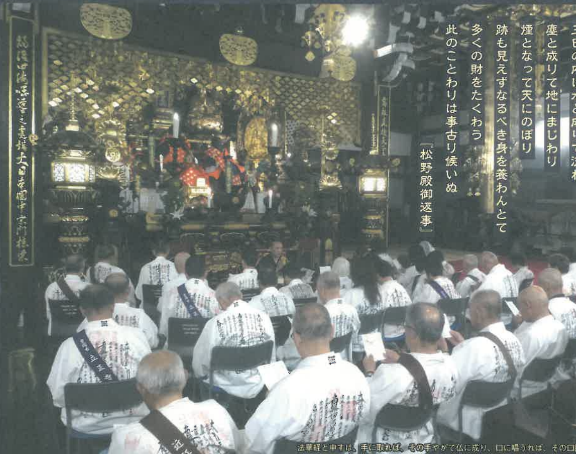
法華経と申すは、手に取れば、その手やがて仏に成り、口に唱うれば、その口即ち仏なり

Q この世の中は、賢い自己中心の人が圧倒的にうまくいっているように思えます。これでは「法華経を信仰してお題目を唱えよ」と言われても、そんなモチベーションが湧かないと思います。