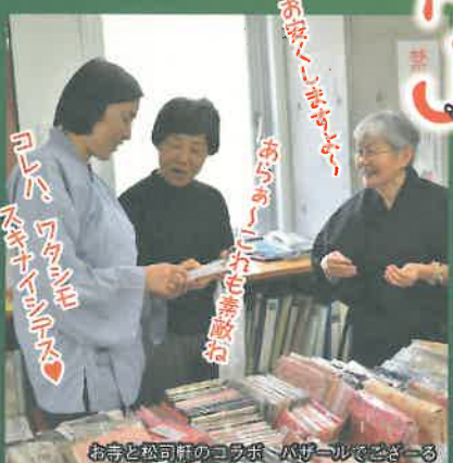
お寺と公園のコラボ パールでござーる