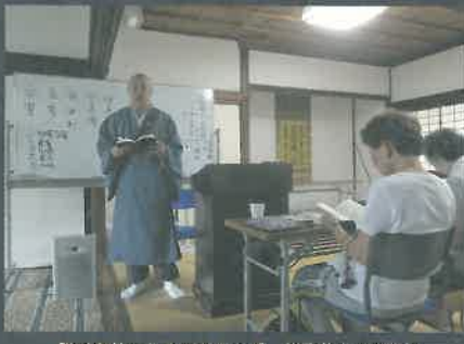
我が身仏になるのみならず、父母仏に在り給う