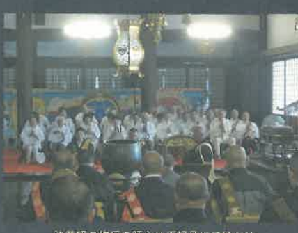
法華経の修行の肝心は不軽品にて候なり

A 人の命とは、とても儂いものです。いつ終わるか分からないこの命を私達は、どう生きるかが大切です。人生とは寿命の長さではなくて、どのよう