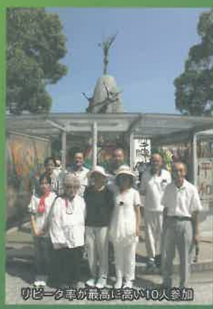
切迫一筆が最高に高い10人参加