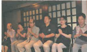
私たちはチココ上人を敬います。