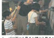
トバは下から見るか横から見るか

目蓮尊者という方は、父を吉占師子、母を青提女と云った。その母が鬼魔道に堕ちたのを、目蓮も凡夫であった間は知らなかったから悲嘆もなかったが、釈尊の御弟子となり、阿羅漢となった天眼という神通力を得るに至って、母が鬼魔道にあるのを知ってしまった。そこで早速、飲食を差し上げたところ、たちまち炎となってますます苦痛を増すばかりであったので、急いで走り帰って、この次第を釈尊に申し上げたのである。そのときの目蓮尊者の心中をお察しなさい。いま貴殿は凡夫であり、肉眼しかお持ちにならないから両親の姿は御覧になれないけれども、もしも父母がそのようにしたらお嘆きにもなるであろう。このご心情こそ孝養の一分である。