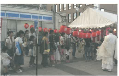
お題目結縁運動のお手本