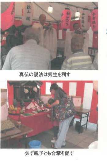
必ず親子とも合掌を促す

人としてこの世に生まれてくることは、まことに偉い事です。それは大地の土は多いが爪の上に乗る土は極めて少ない事と同じ。人間として生きていく命は、草の上の露のように持ちがたいのです。ですが百二十歳までも長生きをして、名を廣らせて死ぬよりは、生きてわずが一日であつても名を高めていく事の方が大切です。貴殿は、主君のためにも、仏法のためにも、また世間の人々に対して、「心根のよい人である」と鎌倉の人々から口々に褒められるように行動した方がよいです。蔵の中に山ほど財を積んでも、身体が弱くては何にもなりません。だから蔵の財よりも身体に備わった財のほうが優れています。また身体がどのよう健康であったとしても、心が平たく豊かである事が第一の財です。だからこの手紙をご覧になったら、心の財を積み上げるようにして下さい。