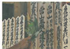
せがきの瀧水焼香は彼は誰時