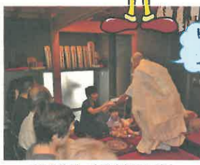
このお礼は一生の宝物にします。