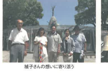
禊子さんの想いに寄り添う