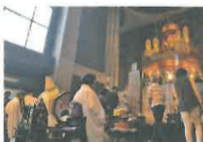
講師チコウと式衆withB