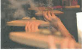
モグサをたく時は煙感注意です!

調子ハッテいる住職には要注意。賢明な人は「依法不依人」という言葉を勉強して下さい。