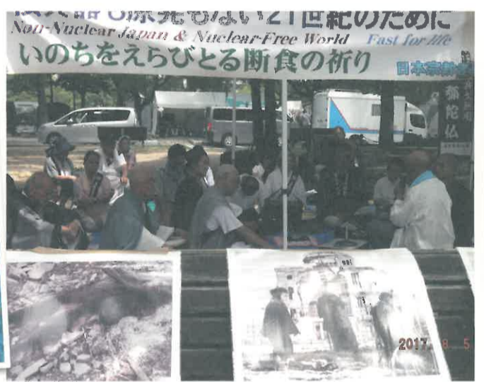
何としてでも被爆者が生きているうちに核兵器廃絶をさせねば。

「南無」という気持ちで、全世界の人が持てれば、真の平和が訪れます。夢でも理想でもなく、実現出来る世界です。