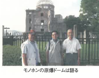
モノホンの原爆ドームは語る