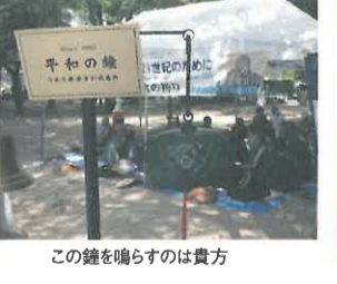
この鐘を鳴らすのは貴方