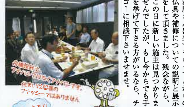
高橋設計士、アガリは船橋のフナツシマはありませぬ 雨はともあれカンパニー!!

私は、今年の春に断捨離を皆さんに勧めました。お寺も今回、処分した物も随分と多いのですが、逆に古い物を再利用する事も大切に考えています。特に、現本堂を建て替える前の旧本堂の仏具や西村上人の結社で使用されていた遺品も当山が保有しています。それらの倉庫に眠っていた物も今回リニューアルして活かしていきたいと思っています。またそんな古い物には、当時の施主が墨書きされている物も多く残されています。お寺で使われる仏具はこうして後世まで大切に使用されます。しかし補修や漆を再度塗り直したりすると、建築とは別に大きな費用がかかってしまうのも事実です。せがき当日は、仏壇の浜屋さんに来てもらってこれらの仏具や補修についての説明と展示をして頂きました。残念ながら、この日に新しい施主は見つかりませんでした。もし今からでも手を挙げて下さる方がいるなら、チコに相談下さいませませ。