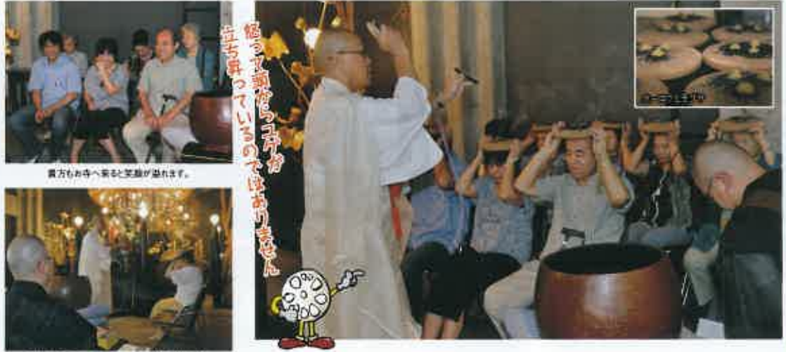
東方のお寺へ来て笑顔が溢れます。 舞りだす清水上人の顔が青白く眩しく見えます