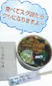
新長田ローソン前で。近所の方は来年ぜひ!!