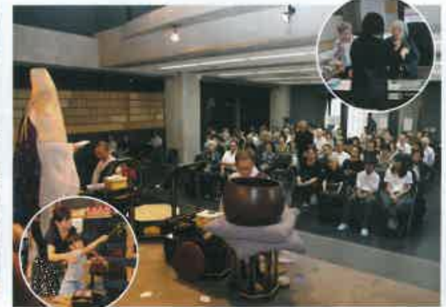
皆が一堂に集まるのは久しぶり。一番本陣に近いの… 初盆で盆せがきの方も多くいらっしゃいました